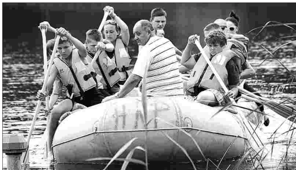
Sturmbootrennen: Der Nachwuchs aus dem polnischen Troszyn trainierte diese Woche schon auf dem Harnekoper Schlossee.

Der Sonntagvormittag startet um 9.30 Uhr mit dem Turmbalzen. Nach dem Gottesdienst (10 Uhr) findet ein buntes Markttreiben statt. Die Kinder können ab 14 Uhr nochmal „Grusimar“ erleben. Das zweite Uchtenhagenfest endet gegen 17 Uhr.